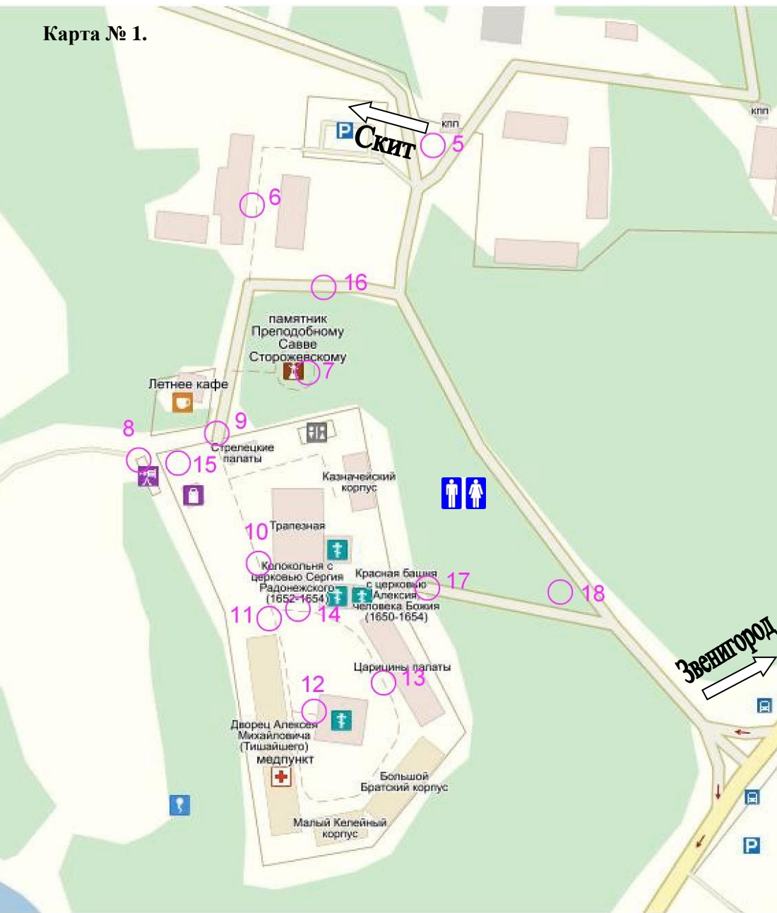
Карта № 1.