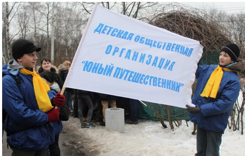
Флаг «Юного Путешественника»

На старте получили задания и карту, узнали новые правила: фототочки в этом году нужно не фотографировать, а внимательно высматривать на территории парка, а если не получается — не беда: карта поделена на квадраты и есть специальные вопросы, подсказывающие, где же искать.